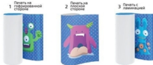
1 Печать на гофрированной стороне